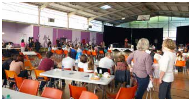
21 juin 2018 : Fête de la musique au gymnase