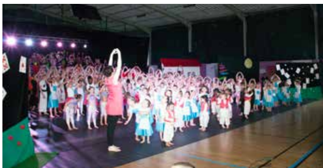
18 et 19 mai 2018 : Spectacle de danse du foyer rural «au pays des merveilles»