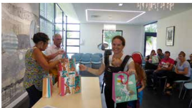
7 juillet 2018 : remise des cadeaux naissance en Mairie