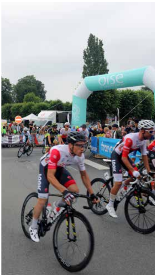
«la Ronde de l'Oise» - Andeville départ ville étape vendredi 8 juin 2018