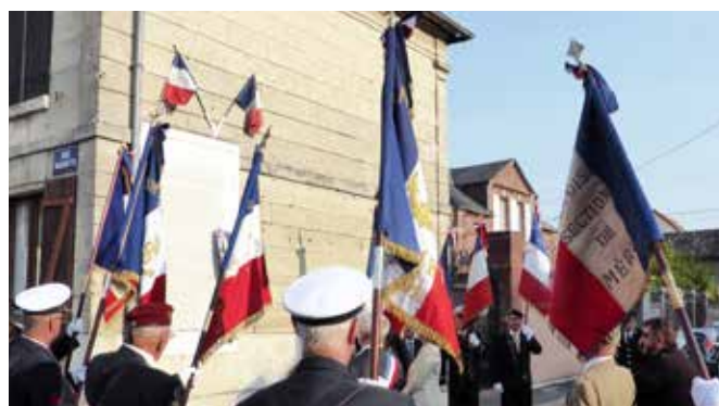
27 août 2018 : cérémonie en mémoire des 17 martyrs