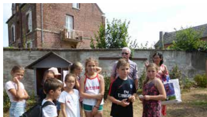
5 juillet 2018 : Les enfants du conseil municipal inaugurent la Boîte à Livres