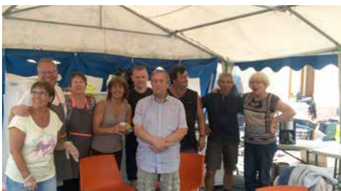
24 juin 2018 : Brocante organisée par l'équipe de l'UNRPA