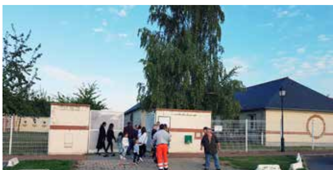
3 septembre 2018 : rentrée des classes à l'école maternelle du Petit Bouton Nacré