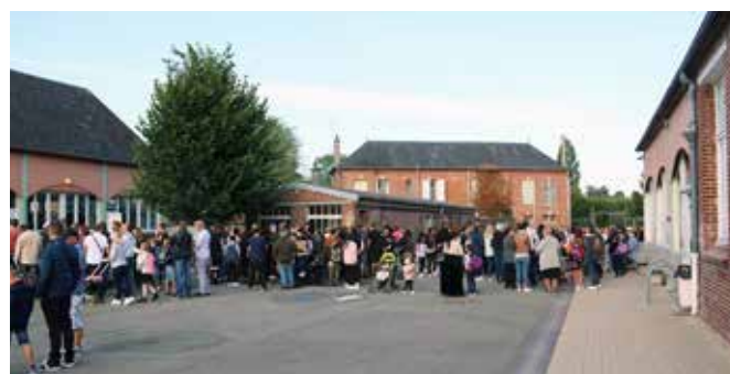
3 septembre 2018 : rentrée des classes à l'école élémentaire Anatole Devarenne