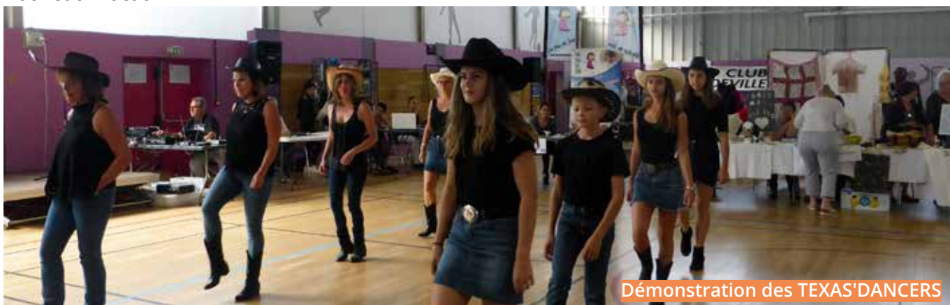
Démonstration des TEXAS'DANCERS