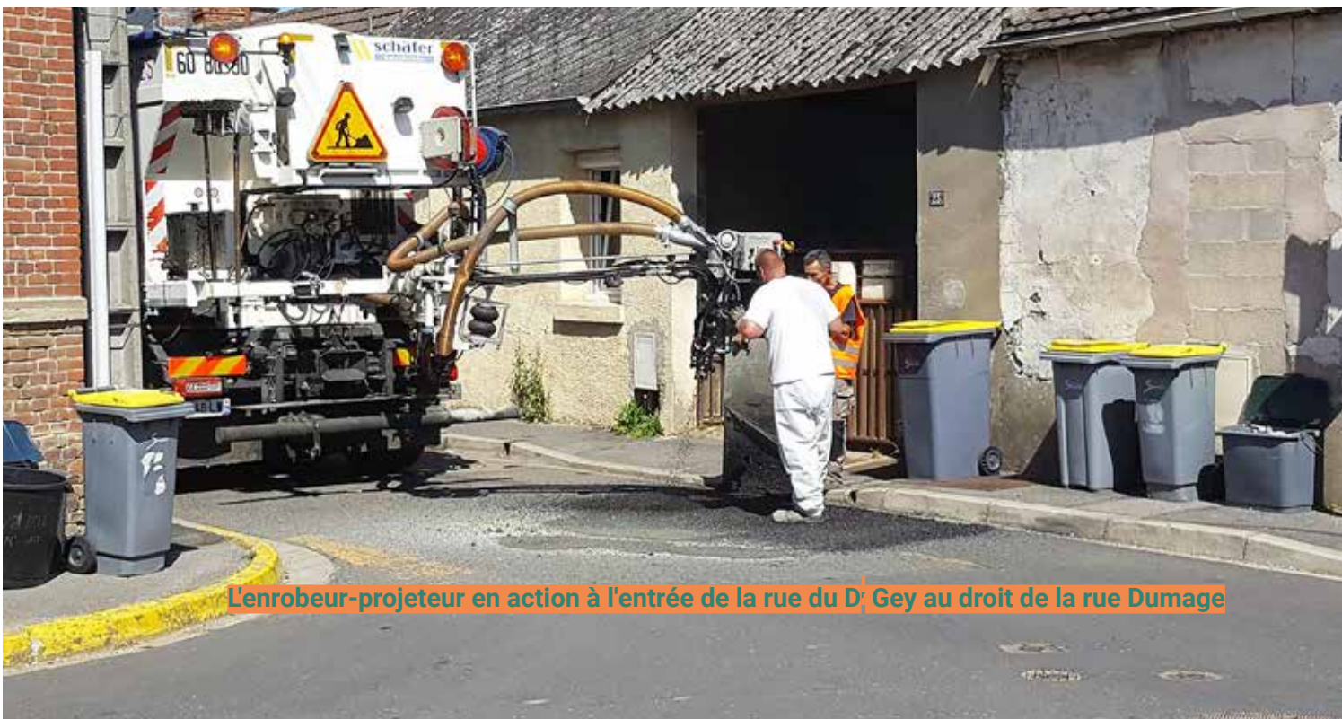
L'enrobeur-projeteur en action à l'entrée de la rue du D r Gey au droit de la rue Dumage

Un excellent rapport-qualité prix (10 056 € TTC) pour des réparations durables !