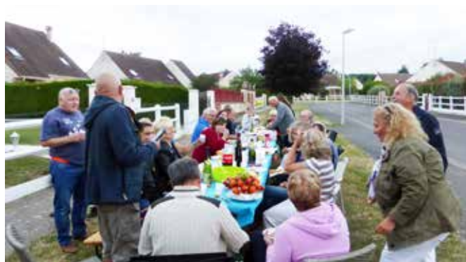
23 juin 2017 : fête des voisins rue des Primevères