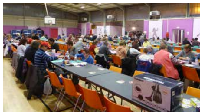
21 octobre 2017 : Toujours autant de monde au loto de l'UNRPA