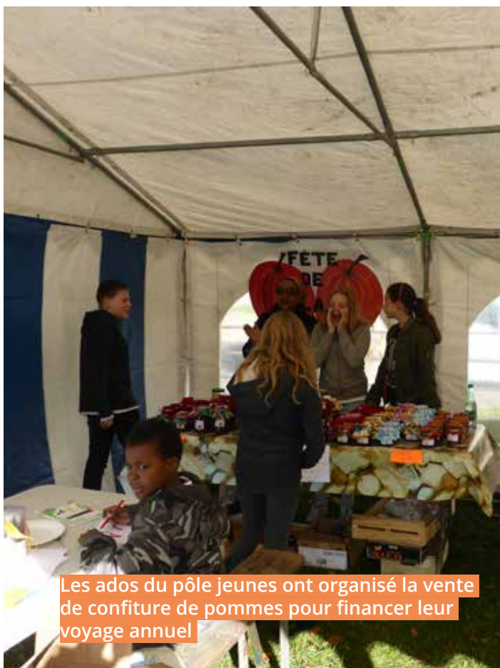
Les ados du pôle jeunes ont organisé la vente de confiture de pommes pour financer leur voyage annuel