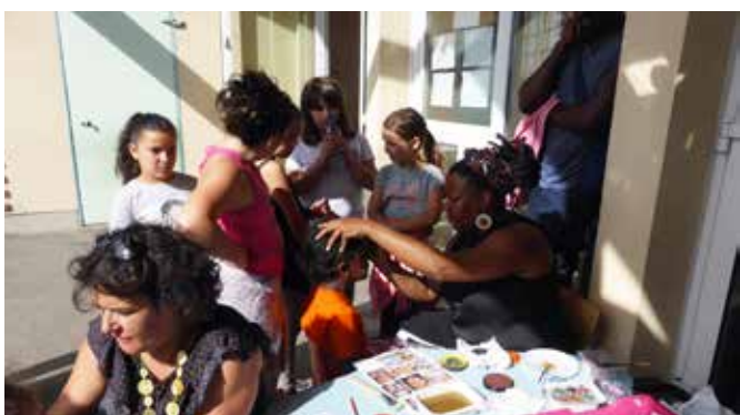
30 juin 2017 : Succès de la kermesse de l'accueil de loisirs