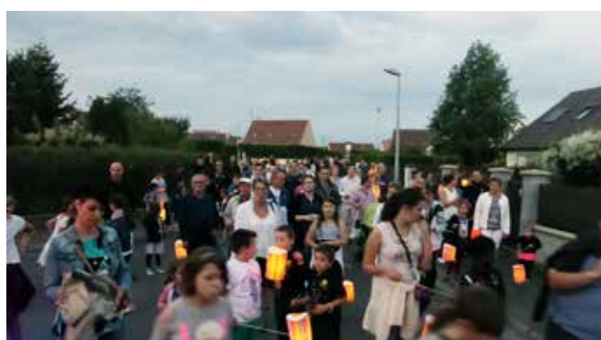
14 juillet 2017 : fête Nationale un défilé avec les lampions