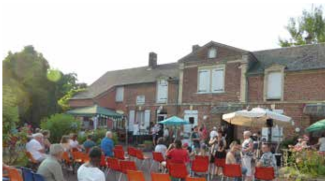
21 juin 2017 : fête de la musique