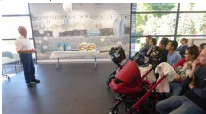
14 octobre 2017 : cérémonie de remise cadeaux aux nouveaux-nés dans la nouvelle salle du conseil