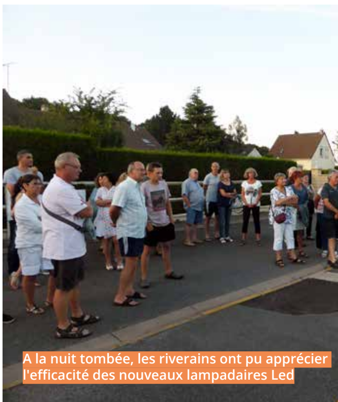
A la nuit tombée, les riverains ont pu apprécier l'efficacité des nouveaux lampadaires Led