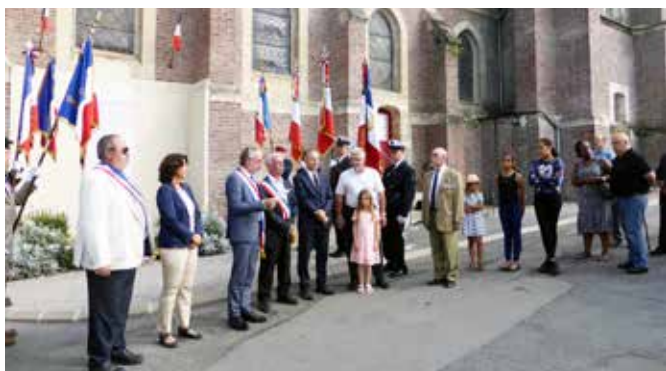
27 août 2017 : Commémoration des 17 Martyrs en présence des personnalités