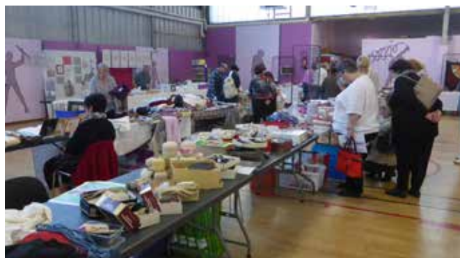
14 octobre 2017 "Puces des couturières" au gymnase