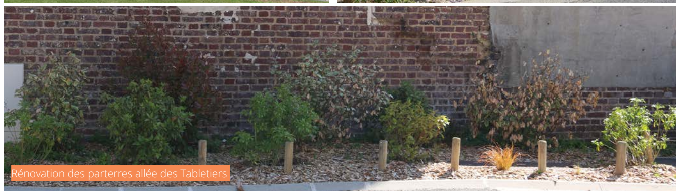
Rénovation des parterres allée des Tabletiers