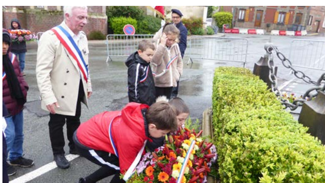
Mercredi 8 mai 2019 : Commémoration du 8 mai 1945 avec les jeunes du conseil municipal des enfants