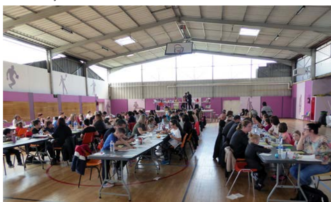
Dimanche 31 mars 2019 : Loto de l'association "Les Gribouilles"