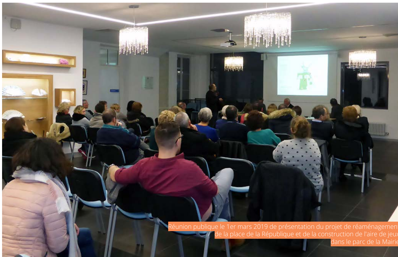
Réunion publique le 1er mars 2019 de présentation du projet de réaménagement de la place de la République et de la construction de l'aire de jeux dans le parc de la Mairie

Ces directives sont le fruit du travail de l'équipe municipale et de l'ensemble des administrations de l'Etat. Je vous rappelle qu'un registre de concertation est disponible, pour vous, en mairie, (ou par courriel à plu@andeville.fr) afin de vous permettre de nous suggérer toutes remarques ou demandes concernant le Plan Local d'urbanisme.