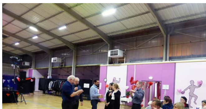
Samedi 16 février 2019 : repas de la Saint-Valentin