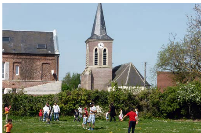
Lundi 22 avril : chasse aux œufs organisée par le CCFA