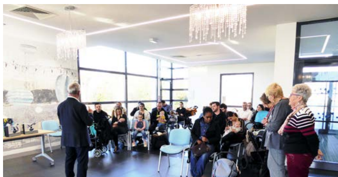
Samedi 16 février 2019 : remise des cadeaux naissance avec le CCAS