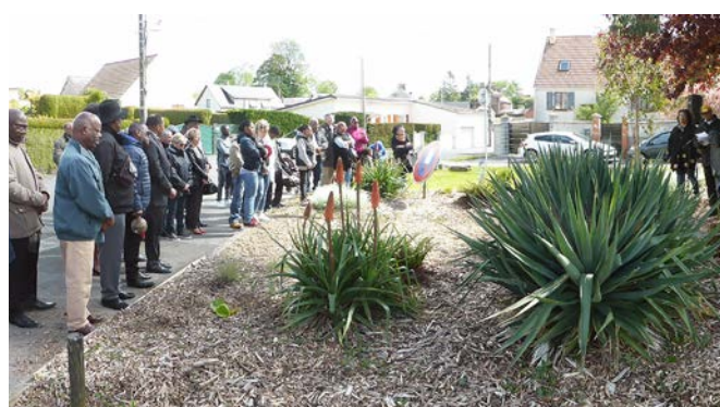
Dimanche 12 mai 2019 : Journée commémorative de l'abolition de l'esclavage