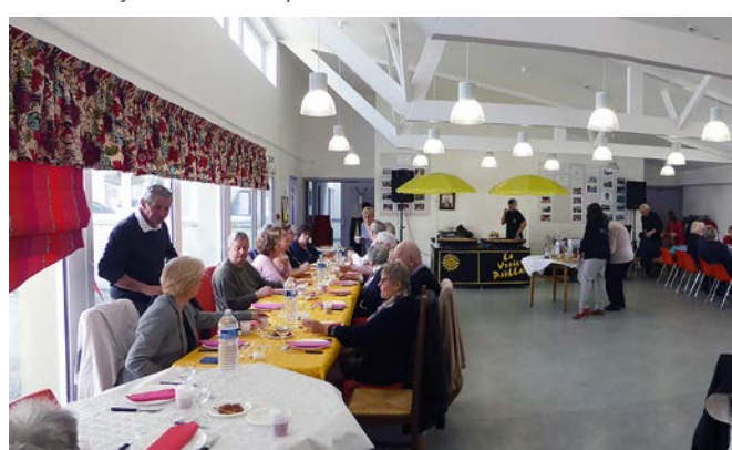
Dimanche 7 avril 2019 : paëlla organisée par l'UNRPA