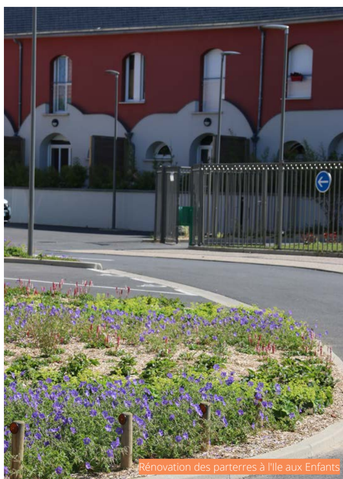
Rénovation des parterres à l'Île aux Enfants