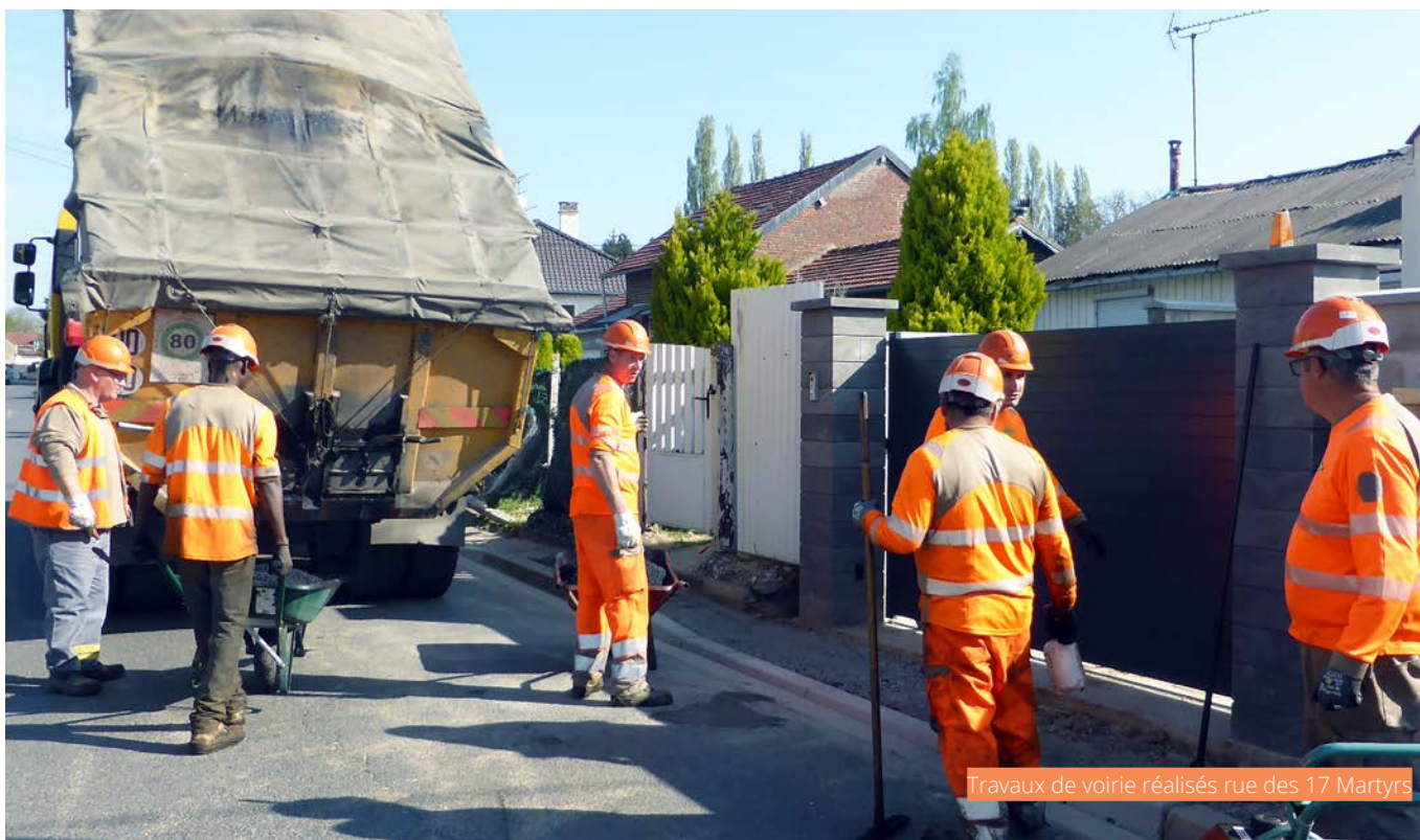
Travaux de voirie réalisés rue des 17 Martyrs