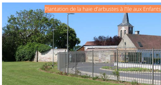
Plantation de la haie d'arbustes à l'Île aux Enfants