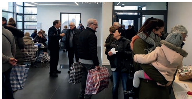
2 décembre 2017 : remise du colis des aînés