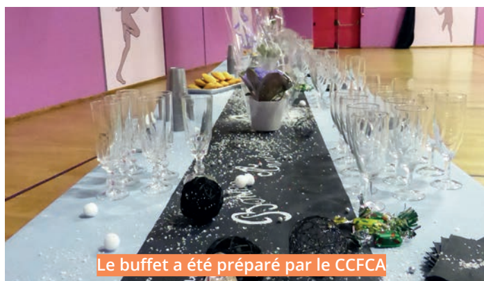
Le buffet a été préparé par le CCFCA