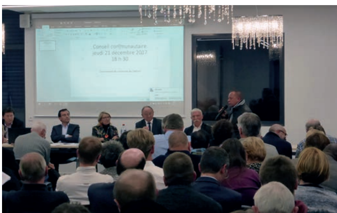
21 décembre 2017 : réunion du conseil communautaire de la communauté de communes des Sablons