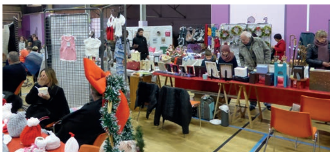
9 et 10 décembre 2017 : Marché de Noël au gymnase