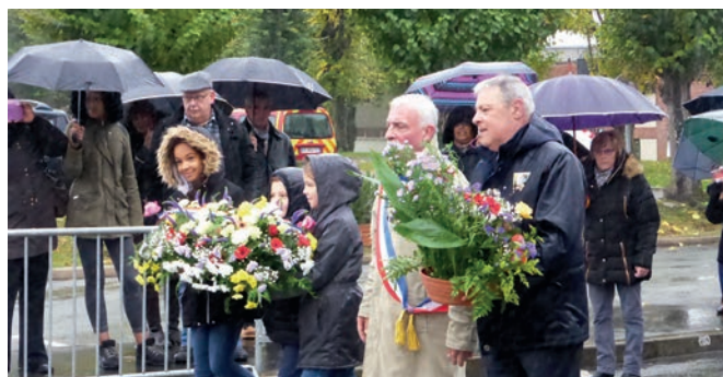
Cérémonie du 11 novembre 2017