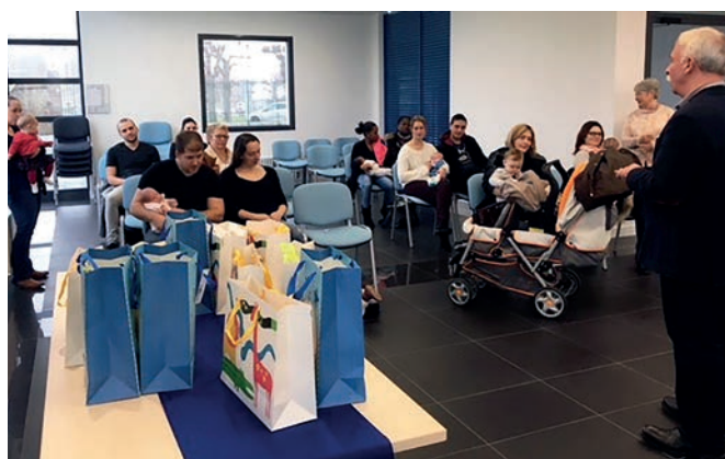
27 janvier 2018 : remise des cadeaux naissances, 50 naissances ont été enregistrées en 2017