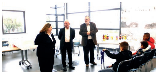
25 novembre 2017 : remise des prix du quizz des enfants