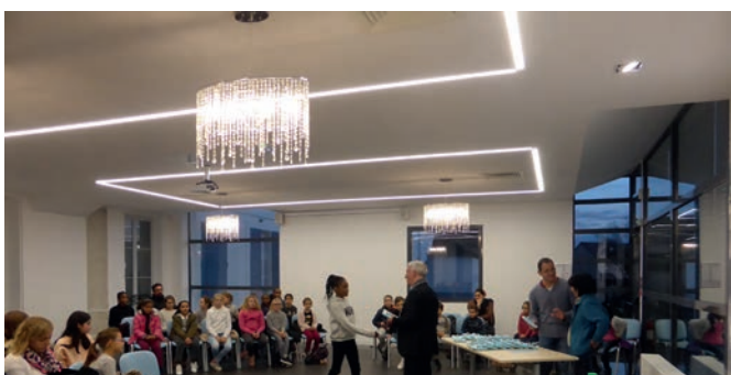
10 novembre 2017 : Installation des conseillers du Conseil Municipal des Enfants