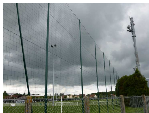
Zone sportive (stade, tennis, city stade, boulodrome)