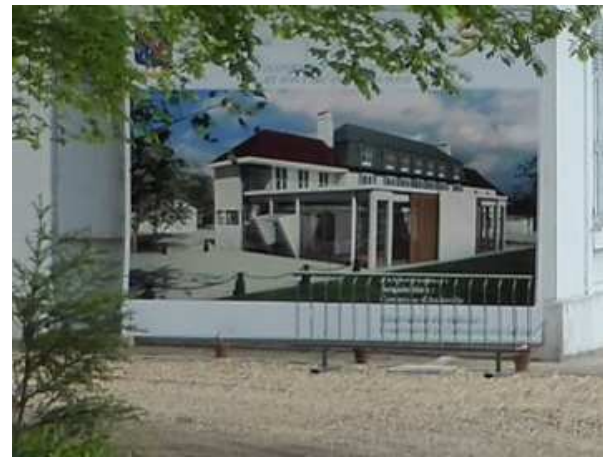
Photo du projet

Le transfert de la Mairie actuelle dans ces nouveaux locaux permettra d'améliorer les conditions de travail du secrétariat, du CCAS qui manque d'un bureau assurant la confidentialité des rendez-vous, de la police municipale, des adjoints, du Maire.