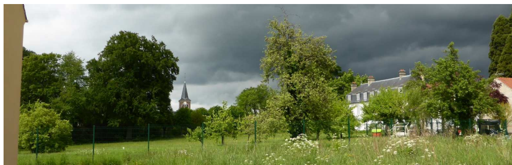
Vue arrière du parc de la future Mairie depuis le lotissement

En remontant par la rue du docteur Nassif, vous passez devant un groupe de 9 maisons réalisées également sur l'ancien terrain appartenant au propriétaire du « château et vendu à un lotisseur. Pour des raisons pratiques de numérotation des maisons, cet ensemble s'appelle « La résidence du cèdre ».